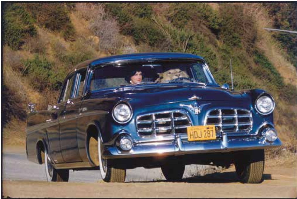
California, USA, 1956. © Elliott Erwitt