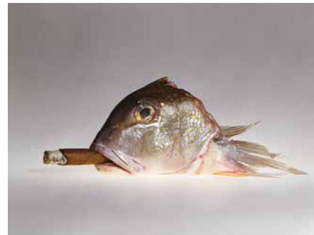
Corbice Cigar with Smoking Fish. © André S. Solidor (aka Elliott Erwitt)