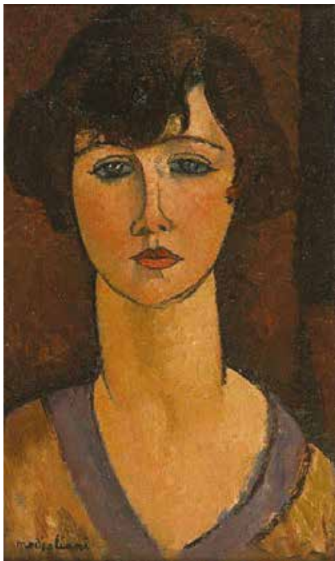
Amedeo Modigliani, Ritratto di Elisabeth Füss-Amore, 1916, olio su tela, 55 x 33 cm, Collezione privata

La mostra si propone di illustrare il suo percorso creativo analizzando le principali componenti della sua carriera breve e feconda, talmente celebre da divenire leggendaria sin da subito, puntando l'attenzione sia sulla scultura che sul ritratto.