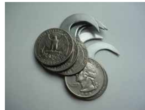
Change, 2005 Twelve twenty-five cent coins, steel box-cutter blades, solder and rivets, approx. 90 x 40 x 40cm

Durata complessiva 2h 30 Scuola primaria e secondaria di I e II grado