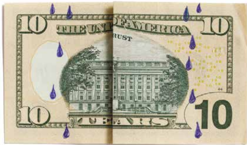
Untitled (Rust & Tears) 2012 Hand folded front or back 10 dollar bill. Unlimited edition. 65x114 mm

La mostra personale di Claire Fontaine presenta una selezione di opere che ruotano intorno all'idea di valore e di frugalità, in relazione all'istituzione a Genova nel 1407 di uno dei primi istituti bancari al mondo, la Casa delle compere e dei banchi di San Giorgio. Il percorso espositivo intende costruire un'esperienza multisensoriale, presentando opere di natura pittorica, scultorea e installativa seguendo il filo conduttore dell'economia. Tra le opere esposte, Secret Money Paintings , realizzate con monete reali, includono la riflessione sul valore economico della pittura e degli scambi commerciali a partire dal sistema artistico; opere scultoree come Change alludono ai metodi per proteggersi da un sistema economico che esclude i più deboli; mentre in Untitled (Money Trap) una cassaforte è stata perforata in modo che la mano possa entrarvi aperta ma non uscire se chiusa, evocando l'avidità ed esibendo anche l'aspetto illusorio dei dispositivi di sicurezza. La mostra sarà introdotta da un'installazione intorno alla storia della finanza genovese realizzata in collaborazione con il Dipartimento di Economia dell'Università di Genova.