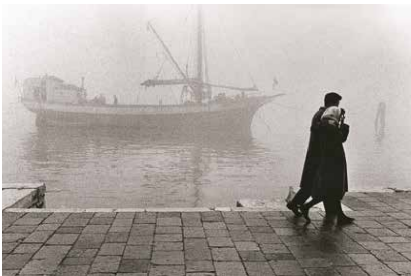
Fulvio Roiter, Fondamenta delle Zattere, 1965 © Fondazione Fulvio Roiter

Il percorso espositivo, circa 150 scatti articolati in nove sezioni, ciascuna espressione di uno specifico periodo della vita e dello stile del grande fotografo, racconta gli immaginari inediti e stupefacenti che rappresentano la Sicilia ed i suoi paesaggi, Venezia e la laguna, ma anche i viaggi a New Orleans, in Belgio, in Portogallo, in Andalusia e in Brasile, che hanno determinato i primi approcci alla fotografia di Roiter nel pieno della stagione neorealista, dalla quale il fotografo veneziano ha ereditato la finezza compositiva.