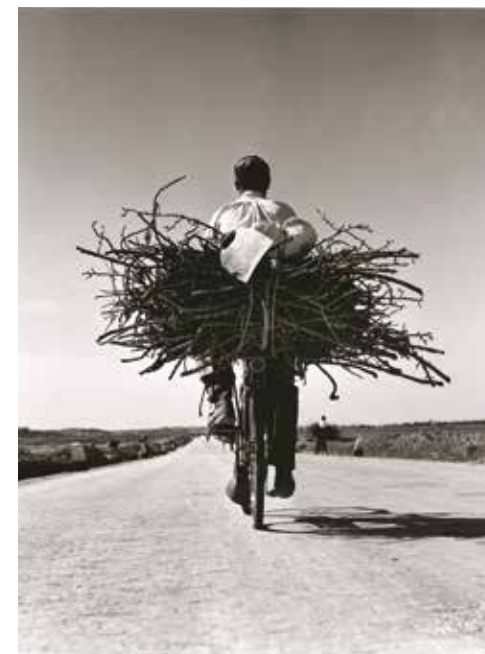
Fulvio Roiter, Salsi strada Gela-Miscomi, Sicilia 1953 © Fondazione Fulvio Roiter

Scuola primaria e secondaria di I e II grado