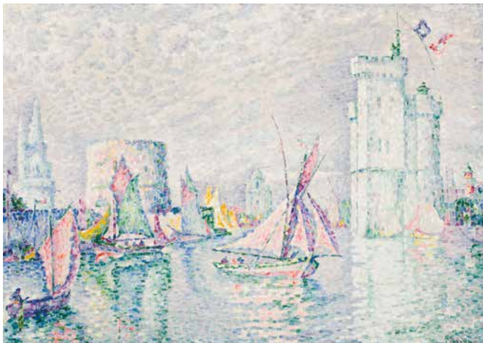
Paul Signac, La rocca 1912, olio su tela, cm 712 x 100 Johannesburg Art Gallery, Johannesburg

Durata 1h 30 Scuola infanzia, scuola primaria e secondaria di I grado